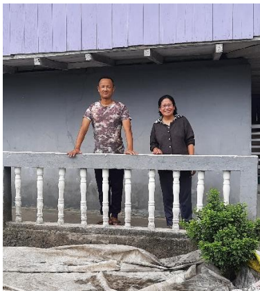
Enjay en echtgenoot