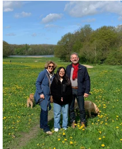
In het Amsterdamse Bos