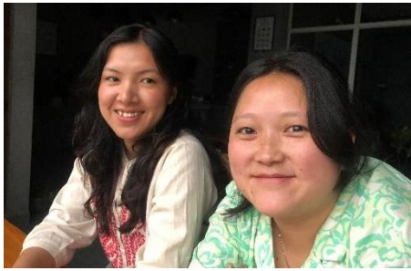
ChunChung en Timsong